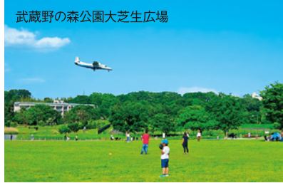
武蔵野の森公園大芝生広場