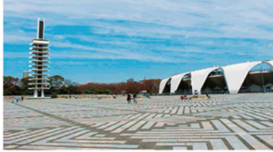
駒沢オリンピック公園